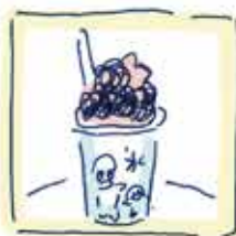
▲いちごミルクシロップが かき出された かき水 (イメージ)

そこで見習い言者君にお原いた!! このおかしな横丁の謎を君たちに解明して もらいたい。既に1中間のツバメーリンたちが 任務に当たり、下の様な暗号カードを君 たちだけに分かるようにおかしな横丁各所に 隠しているよ! この暗号を集めて謎を